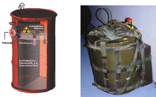
Obrázok 3 Rádiologické zbrane

Rádioaktívne látky je možné použiť vo forme dymu, prášku, hmly, aerosólového postreku a podobne. Môžu byť použité samostatne alebo spolu s chemickou toxickou látkou, zápalnými, dymotvornými či biologickými prostriedkami